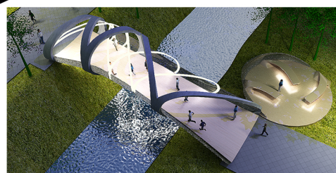
Wizualizacja nocna mostku "D"