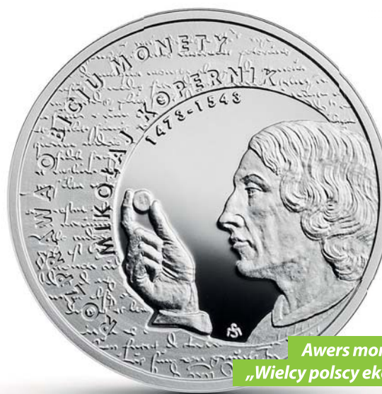
Awers monety z serii „Wielcy polscy ekonomiści”