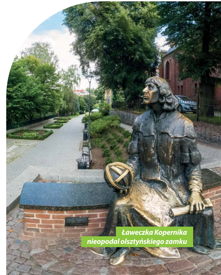
Ławeczka Kopernika nieopodal olsztyńskiego zamku

I choć nie we wszystkich sferach działalności Kopernik zaznaczył swoją obecność w dziejach tak rewolucyjnie, jak to miało miejsce przy astronomii, to w przypadku ekonomii jego dokonania każą stawiać go w rzędzie najwybitniejszych polskich ekonomistów w historii.